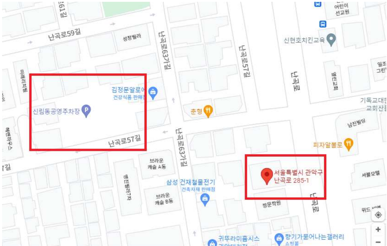
[ 주차장 ] 신림동 공영주차장